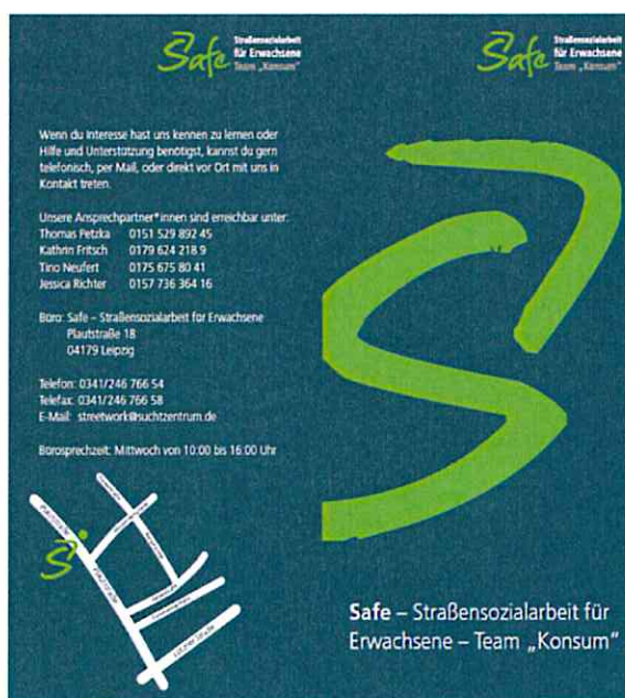
(Beispielflyer von „Safe – Straßensozialarbeit für Erwachsene“ aus Leipzig)

Die Mitarbeiter*innen sind außerdem mit gut erkennbarer Arbeitskleidung (T-Shirts, Pullover, Jacken, Rucksäcke), mit Aufdrucken wie „Streetwork“ oder „Straßensozialarbeit“ ausgestattet. Zu den Standzeiten werden Aufsteller/Beachflags o.ä. mit Projektinfos verwendet.