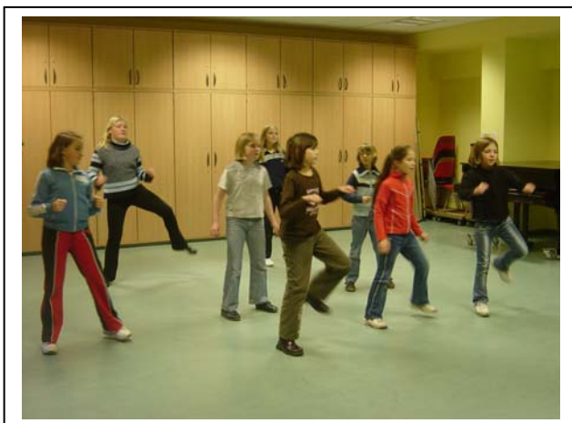
< die Mädchen sind begeistert dabei.

> Auch an der Alkoholfreien Cocktailparty am 02.12.05 nimmt die Trainerin teil.