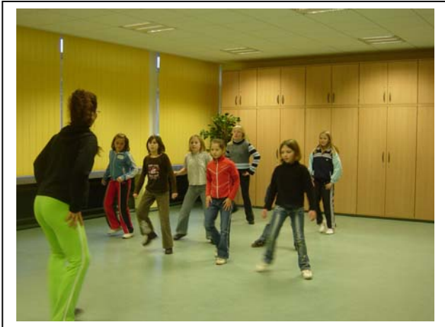
< die Trainerin und die Mädchen beim Training